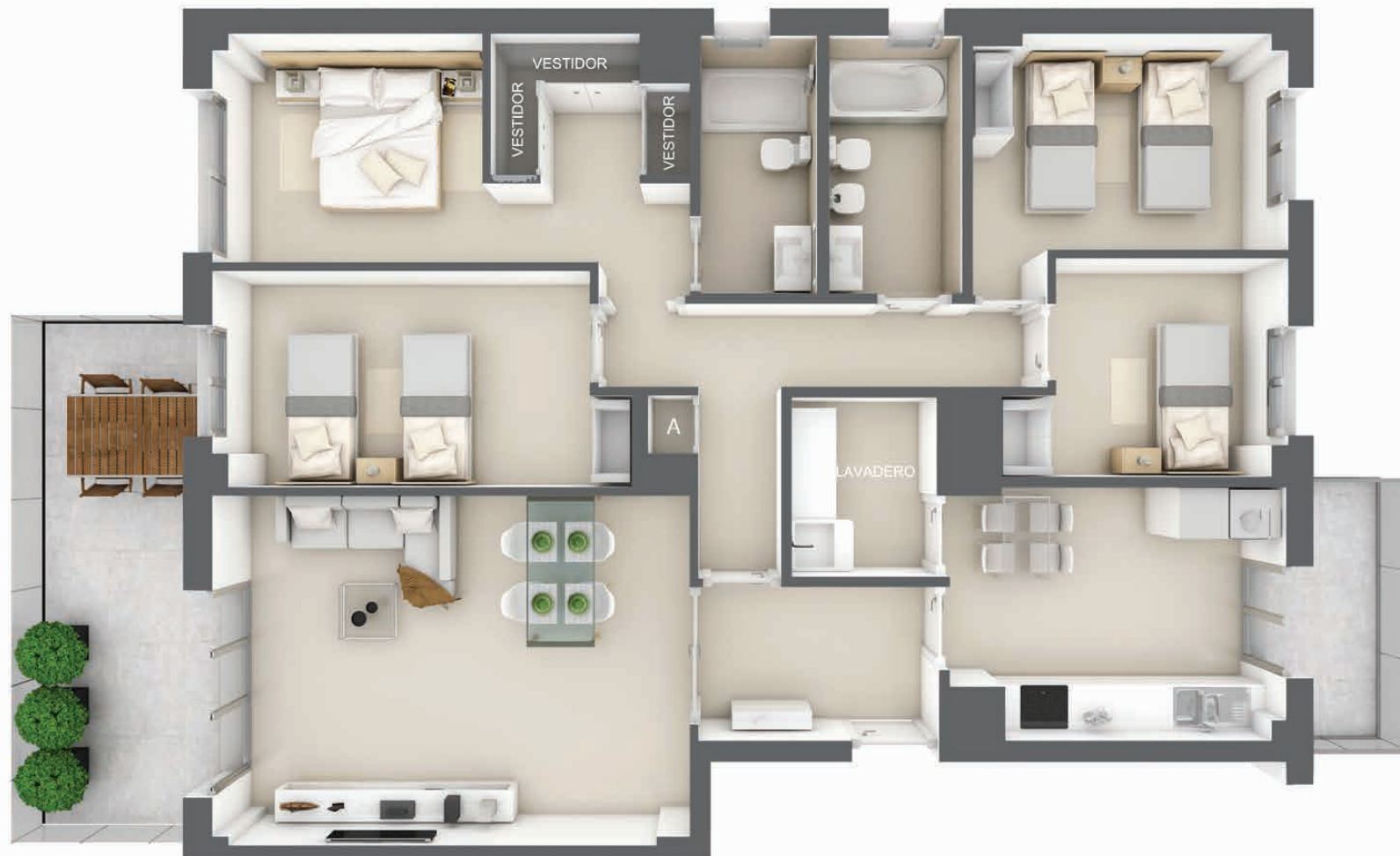
Vivienda TIPO de 148 m 2